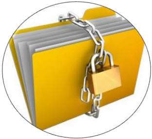
Protección de Datos Personales