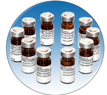
Materiales Patrón de Referencia