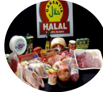
Certificación de Alimentos Halal