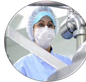
Buenas Prácticas de Laboratorio