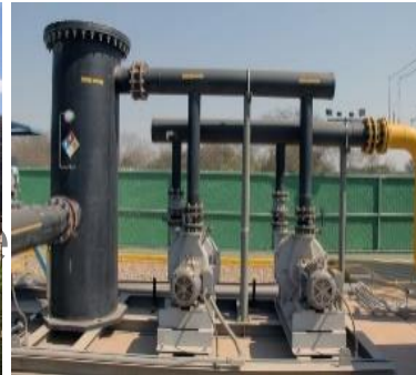
Relleno sanitario de Aguascalientes