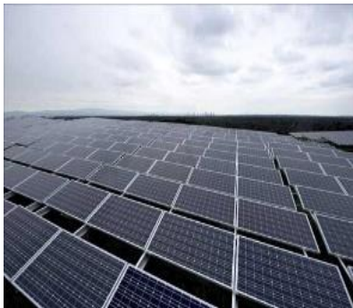
Planta solar en Baja California: Aura Solar