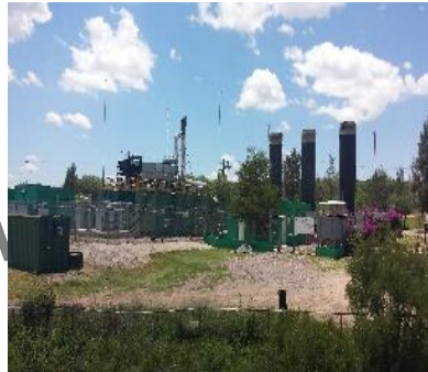
Recuperación, quemado y utilización del biogás, relleno sanitario en Culiacán Norte