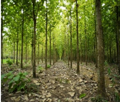
Proyecto Forestal en Chiapas, Nayarit y Tabasco