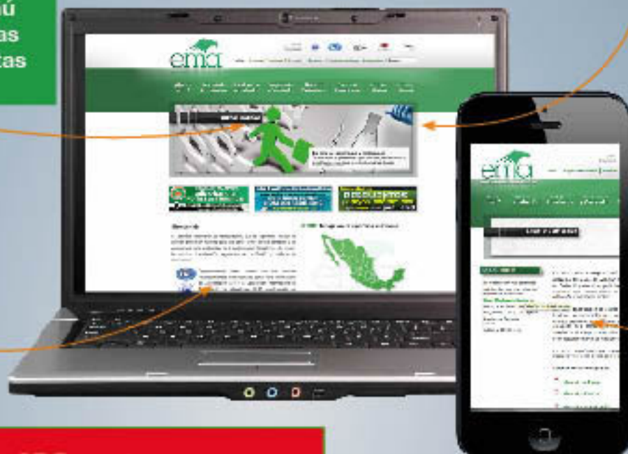
Imagen más atractiva: menos saturación de color.

¡Mantenemos la misma dirección! www.ema.org.mx